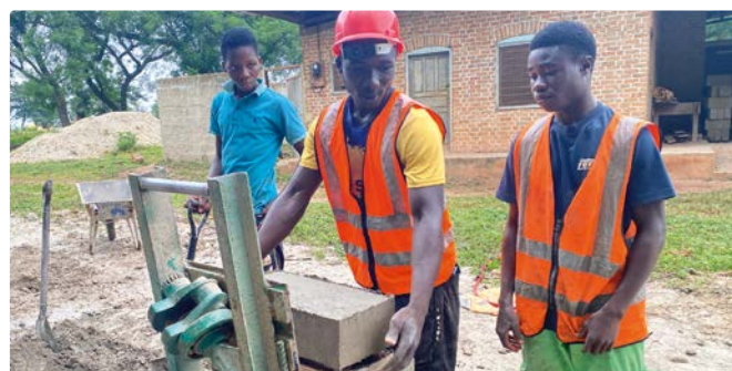
Preiswert und praktisch: Ziegel stellt ein Team unter Anleitung eines erfahrenen Maurers auf der Baustelle selbst her.

Sauber und präzise muss es sein. Messen, anzeichnen, mauern... Der Bau des Wohnheims ist für die Azubis auch „learning by doing“.