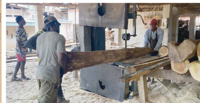
In der Ausbildungs-Tischlerei werden unterdessen aus Baumstämmen Bretter und später z.B. Fenster und Türen.