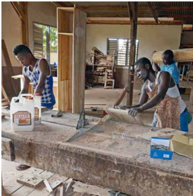
Auszubildende in der Schreinerei

Unsere Handwerksschule in Kwasibuokrom in Ghana/Westafrika gleicht einer Werkstatt fürs Leben: Beim Hobeln und Schweißen, Programmieren und Installieren bekommen junge Menschen den notwendigen Feinschliff, um nach ihrer Ausbildung eine gute Stelle zu finden. Auch Pflegerinnen und -anwärter der benachbarten Schule werden hier unterrichtet, damit sie sich selbst und möglicherweise auch ihre Familien schon bald mit ihrem Verdienst ernähren können. Wir, die Missionsbrüder des heiligen Franziskus, gewähren diesen fleißigen, aber mittellosen jungen Menschen Unterkunft, Verpflegung und ein unbezahlbares Gut: eine Ausbildung, die ihre Zukunft sichert und ihnen Perspektiven im eigenen Land eröffnet.